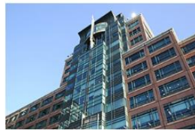
EBRD headquarters, London

Our operations extend across three continents and almost 40 economies and within a broad range of sectors.